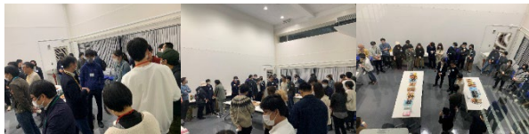
工学部松韻会館にて

また、4月26日(水)18時より、R5年度のCEReS新入生・新人歓迎会・顔合わせ会を開催しました。今年度は、コロナウイルスの感染状況がやや落ち着き、感染対策に係る諸々の制限も緩和されてきている状況にあることから、数年ぶりに工学部同窓会の松韻会館にて飲食あり(ただしアルコールなし、軽食のみ)の対面形式で実施しました。教員・研究員、非常勤職員、学生合わせて70名(教職員18名、学生52名)の参加者があり、久々の対面での交流を楽しめたのではないかと思います。普段は同じセ