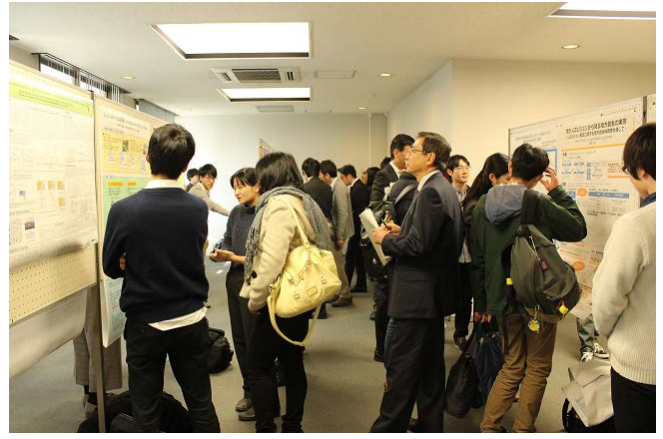
ポスターセッション