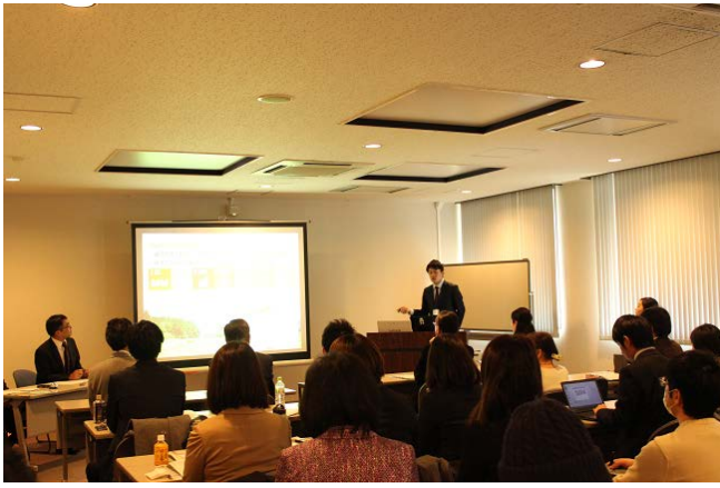
学生セッションの様子