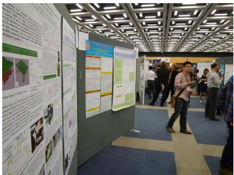
パネル展示の様子