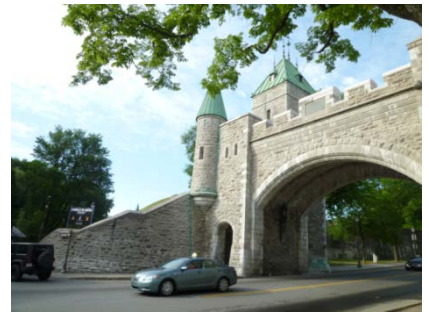
Château Frontenac とケベックの町並み