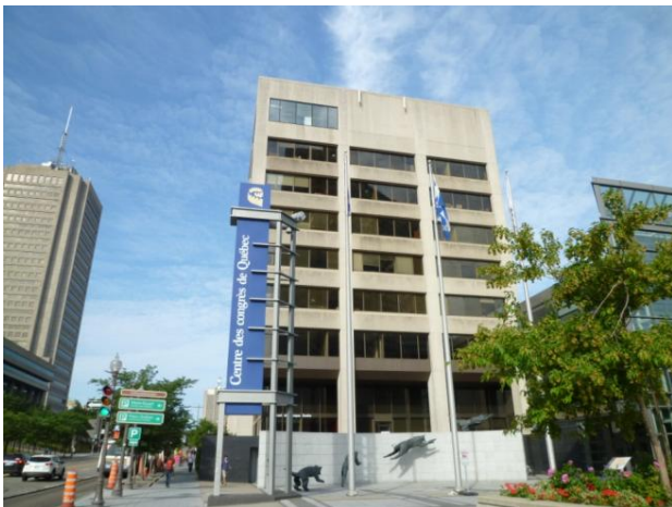
ケベック国際会議場