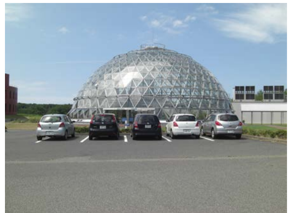
写真2：乾燥地研の象徴的な施設であるアリドーム実験棟。

最初に案内してもらったのは、アリドーム実験棟の隣にある乾燥地学術標本展示室でした。ここには世界中から収集した砂（写真3）や、講演用のミニシアターや、乾燥地域の民族衣装、鳥取砂丘で栽培可能な作物研究の歴史等（写真4）、本格的なものでした。なお、この標本展示室は休日に無料公開しているそうです。この時点でうち（CEReS）とは違うなあ…と関心しきりです。それもそのはず、センターの原形となる砂丘試験地が設けられたのが大正12年（1923年）とのことで、90年以上の歴史があるセンターです。その後、アリドーム実験棟の中に入れて頂き、作物実験・塩分動態モニタリ