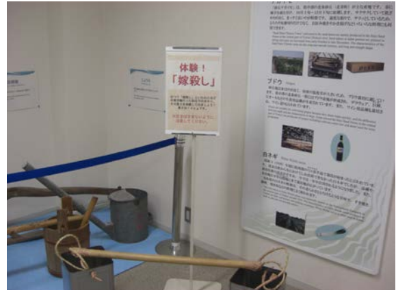
写真4：同展示室にあった“体験「嫁殺し」”。砂丘での水やりがいかに大変だったかを体験。キーワード反動的に写真を撮ってしまった…。

続いて、試験農場やグロースチャンバー実験棟に移動します。この中には、乾燥地の気象を再現できるグロースチャンバー、温暖化チャンバー、最新の施設であるデザートシミュレーター等、豊富な室内実験設備がありました。訪問時は電力削減のため、デザートシミュレーターの多くは稼働させていない状態でしたが、この設備は共同利用での人気設備とのことで、あまりに利用要望が多いため、センター内部の研究者が使用することが困難（共同利用研究を優先するため）とのこと。ほかにも国際ショナル・アリド・ラボ実験棟や、本館屋上の観測設備等も見せて頂き、詳しい説明が無くとも見て回るだけで2時間以上かかりました。「これは東京から文部科学省の役人が視察に来ても半日は余裕で対応できるね」とつい言ってしまったのは、同じ共同利用研究拠点所属教員の悲しい性なのでしょうね。