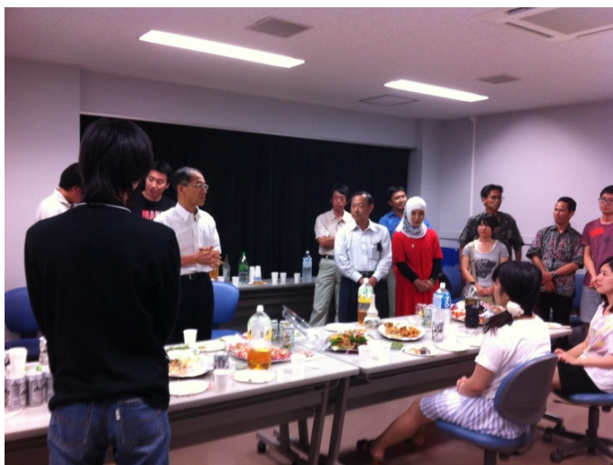
新人歓迎会の様子

7月25日(金)に、CEReS 新入生歓迎会が開催されました。CEReS は教員と学生が融合科学研究科と理学研究科に分かれて所属しているため、特に学生は同じ建物にいながら他学科・研究科の教職員や学生と交流する機会がほとんどないことから、新人の歓迎と他研究室・他学科・他研究科の交流を兼ねて毎年催されています。建石センター長からご挨拶頂き、参加した教員がそれぞれ自分の研究や思うところ?を述べるなど、終始和やかな雰囲気での歓迎会となりました。(齋藤 尚子)