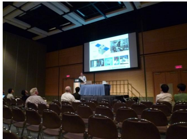
TU1.04: Airborne SAR