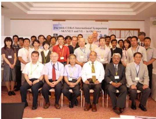
第 13 回 CEReS 国際シンポジウム開催