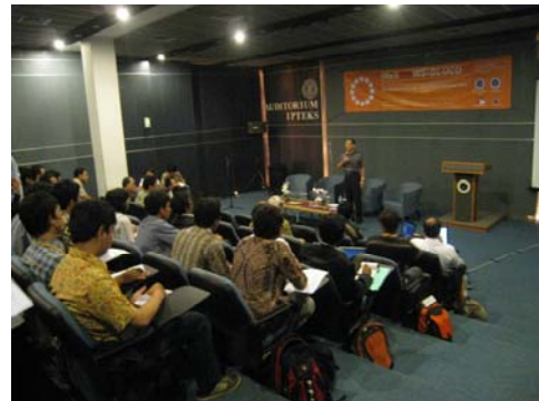
ITB 第3回国際リモートセンシング GIS ワークショップ風景