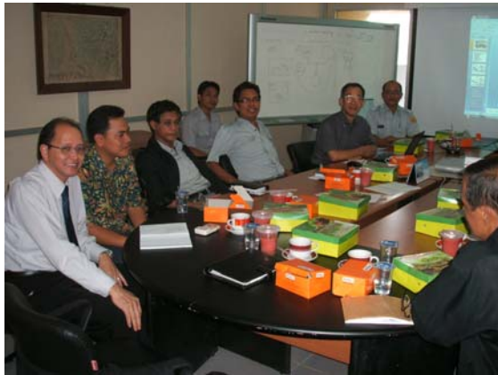
BAKOSURTANAL の職員との意見交換