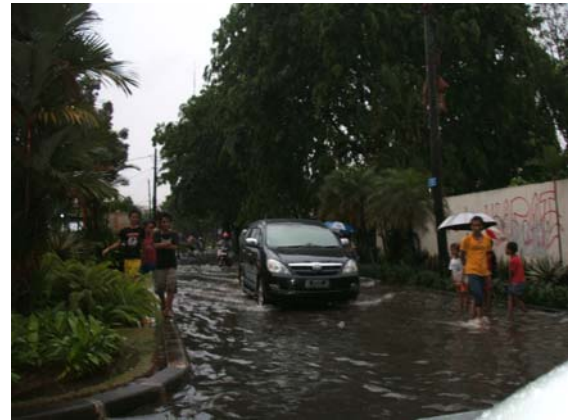
スクール後の浸水道路、ジャカルタ郊外